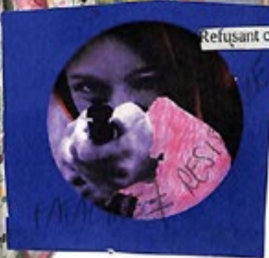
Refusant cette fatalité, Nedjma décide de se battre

L'amour comme une posture de changement social